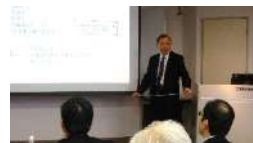
スライドで講座を進行し確認問題を行います