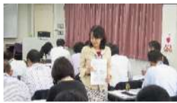
ワークを通して理解を深めます。